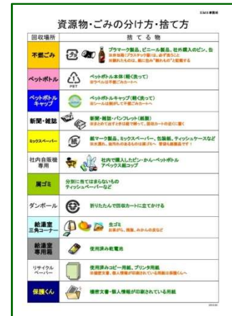
ポスター:「資源物・ごみの分け方・捨て方」

各事業所の所在する自治体の条例を参考に、一般事業所の産業廃棄物処理法に基づき、物資源物とゴミを分別し、資源物はリサイクルへ、ゴミは適正な方法で廃棄しています。