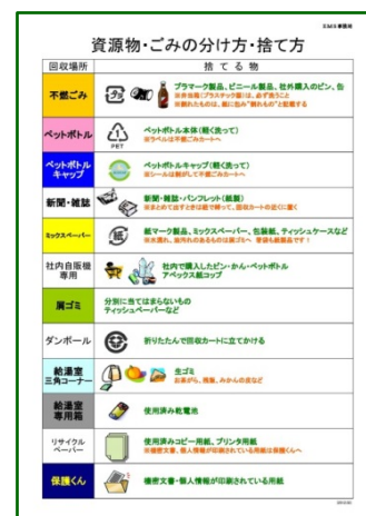
キャンペーン・ポスター:「資源物・ごみの分け方・捨て方」

各事業所の所在する自治体の条例を参考に、一般事業所の産業廃棄物処理法に基づき、物資源物とゴミを分別し、資源物はリサイクルへ、ゴミは適正な方法で廃棄しています。